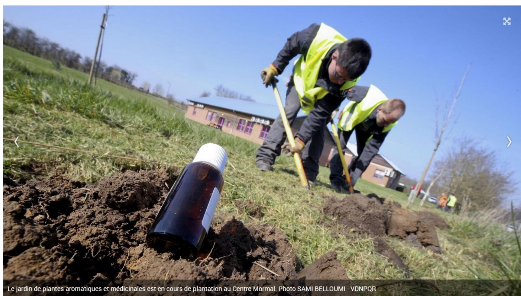
Le jardin de plantes aromatiques et médicinales est en cours de plantation au Centre Mormal.

Sur près d'un hectare de terrain, prêté par le Centre Mormal, une dizaine de travailleurs en situation de handicap de l'ESAT du Quesnoy, ont relevé les manches, et s'activent, bêche à la main, pour planter des arbres, arbustes et plantes aromatiques aux vertus médicinales . Ce jardin fera figure de sorte de « sanctuaire », avec cet objectif de les transformer à terme en huiles essentielles. Le choix des variétés a été scrupuleusement étudié par un botaniste de renom, Jean-Claude Bruneel, membre de Planète Aroma, des plantes locales, qu'il regroupe sous une sorte de label de « Plantes d'Ichi ».